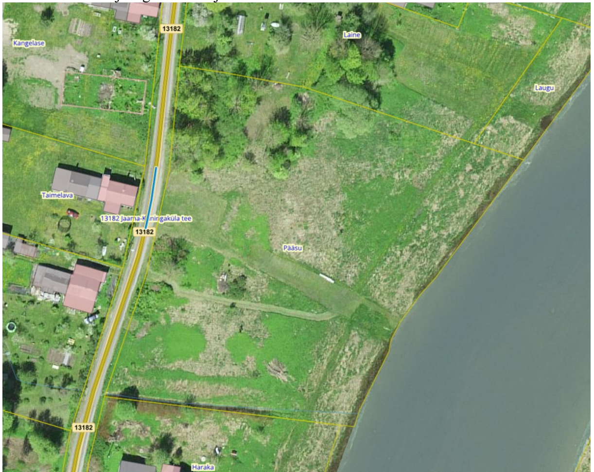
Joonis 1. Ristumiskoha asukoha võimalik vahemik tähistatud sinise joonega.